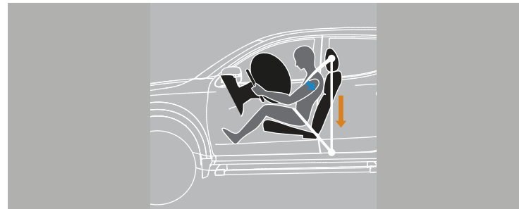
PRETENSORES DE CINTURÓN DE SEGURIDAD