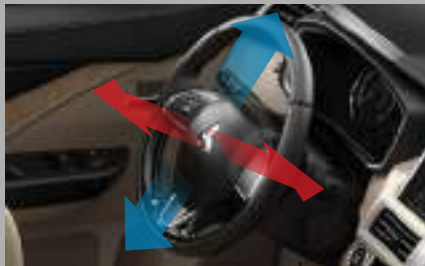
VOLANTE AJUSTABLE EN ALTURA Y PROFUNDIDAD