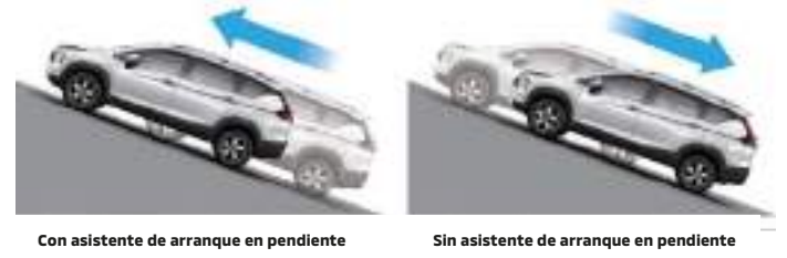
ASISTENTE DE ARRANQUE EN PENDIENTE