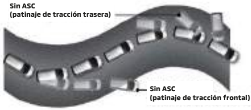
CONTROL DE ESTABILIDAD Y TRACCIÓN