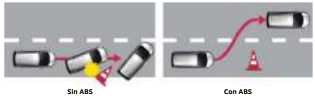
SISTEMA DE FRENOS (ABS)