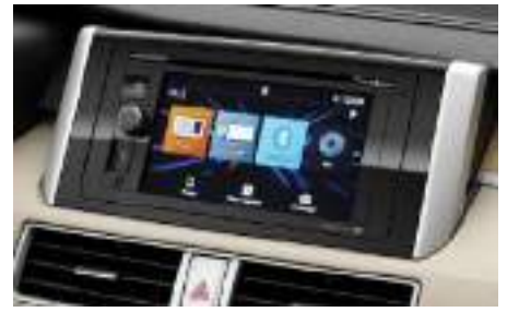
Smartphone-link Display Audio (SDA) con pantalla táctil de 7"