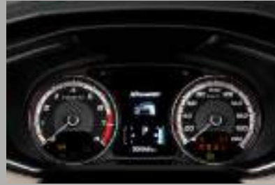
PANTALLA DE INFORMACIÓN MÚLTIPLE

*Verificar equipamiento según versión en la tabla técnica.