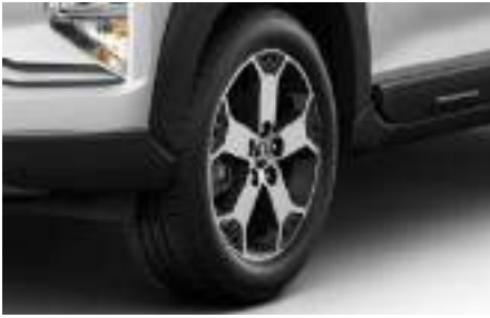
Llantas y rines: 205/55R17 + 17" Aleación