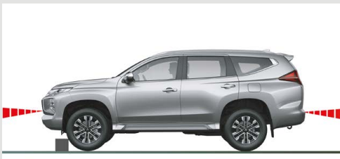
SISTEMA ULTRASÓNICO DE MITIGACIÓN DE ACCELERACIÓN POR ERROR (UMS)