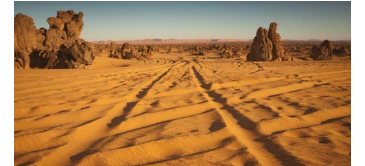
arena, nieves profundas, etc.