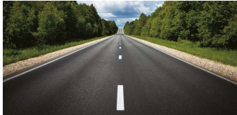
Para condiciones normales de la carretera.