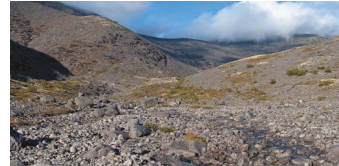
superficies de bajo agarre.