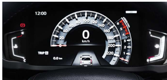
PANTALLA DE INFORMACIÓN MÚLTIPLE LCD A COLOR