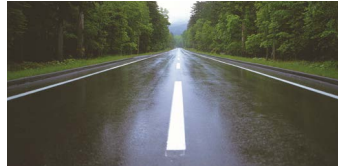
Para carreteras en mal estado