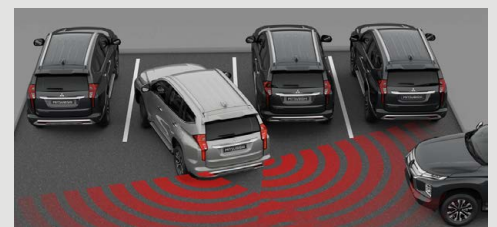
Alerta de tráfico cruzado trasero [RCTA]