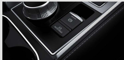
FRENO DE ESTACIONAMIENTO ELECTRÓNICO