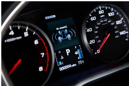
TABlero DE INSTRUMENTOS DE ALTO CONTRASTE CON LCD, MULTI INFORMATION DISPLAY Y REÓSTATO

Presenta un elegante diseño interior. El panel de instrumentos dispuesto horizontalmente fluye dinámicamente con detalles plateados meticulosamente diseñados y materiales refinados.