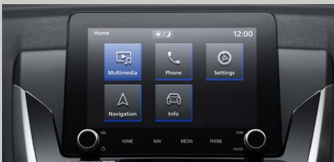
SMARTPHONE LINK DISPLAY AUDIO