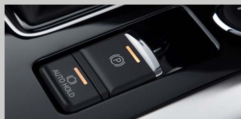
FRENO DE PARQUEO ELÉCTRICO (EPB) CON AUTO HOLD