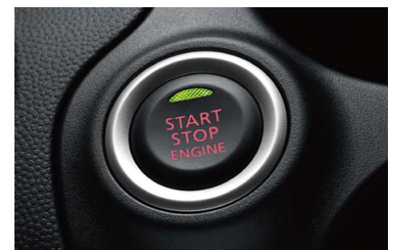
BOTÓN START/STOP ENGINE

Las características y especificaciones que aparecen en esta ficha técnica están sujetas a cambios sin previo aviso.