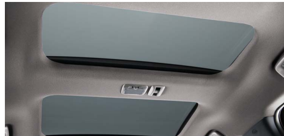
TECHO CORREDIZO PANORÁMICO CON CONTROL ELÉCTRICO