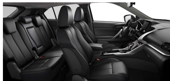
TAPICERÍA EN CUERO CON SILLAS DELANTERAS CON MANDO ELÉCTRICO, CALENTADOR, Y BOLSILLO TRASERO.