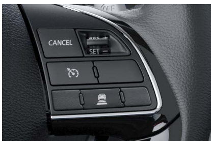
CONTROL DE VELOCIDAD CRUCERO